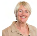
Siân Gwenllïan AC