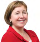
Lynne Neagle AC (Cadeirydd) Llafur Cymru Torfaen