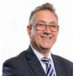
Mick Antoniw AC Llafur Cymru Pontypridd