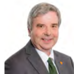
Dai Lloyd AC Plaid Cymru Gorllewin De Cymru