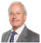
Neil Hamilton AC UKIP Cymru Canolbarth a Gorllewin Cymru