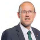
Llyr Gruffydd AC Plaid Cymru Gogledd Cymru

Mynychodd yr Aelod a ganlyn fel dirprwy yn ystod yr ymchwiliad hwn