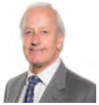
Neil Hamilton AC UKIP Cymru Canolbarth a Gorllewin Cymru