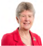
Jane Hutt AC Llafur Cymru Bro Morgannwg