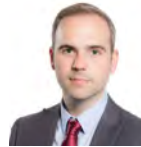
Steffan Lewis AC Plaid Cymru Dwyrain De Cymru