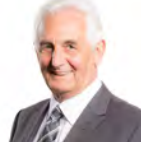
David J Rowlands AC UKIP Cymru Dwyrain De Cymru