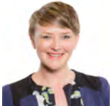
Bethan Sayed AC Plaid Cymru Gorllewin De Cymru