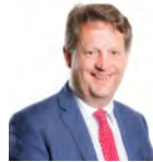
Alun Davies AM