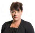
Rhianon Passmore AM