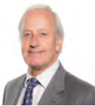
Neil Hamilton AC