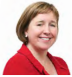
Lynne Neagle AC Llafur Cymru Torfaen