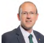
Llyr Gruffydd AC Plaid Cymru Gogledd Cymru