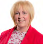
Suzy Davies AC Ceidwadwyr Cymreig Gorllewin De Cymru