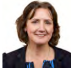
Janet Finch-Saunders AC Ceidwadwyr Cymreig Aberconwy