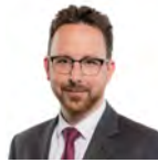
Hefin David AC Llafur Cymru Caerffili