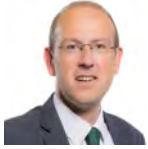
Llyr Gruffydd AC Plaid Cymru Gogledd Cymru