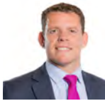
Rhun ap Iorwerth AC Plaid Cymru Ynys Môn