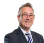
Mick Antoniw AC Llafur Cymru Pontypridd

Mynychodd yr Aelod a ganlyn fel dirprwy yn ystod yr ymchwiliad hwn: