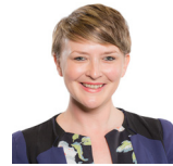
Bethan Sayed AC Plaid Cymru Gorllewin De Cymru