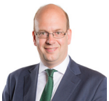
Mark Reckless AC Plaid Brexit Dwyrain De Cymru

Roedd yr Aelodau a ganlyn hefyd yn aelodau o'r Pwyllgor yn ystod yr ymchwiliad hwn.