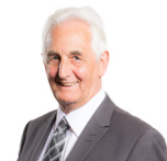
David j Rowlands AC Plaid Brexit Dwyrain De Cymru