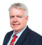
Carwyn Jones AC Llafur Cymru