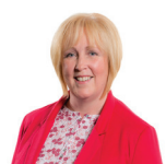
Suzy Davies AC Ceidwadwyr Cymreig