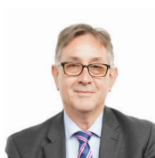
Mick Antoniw AC Llafur Cymru