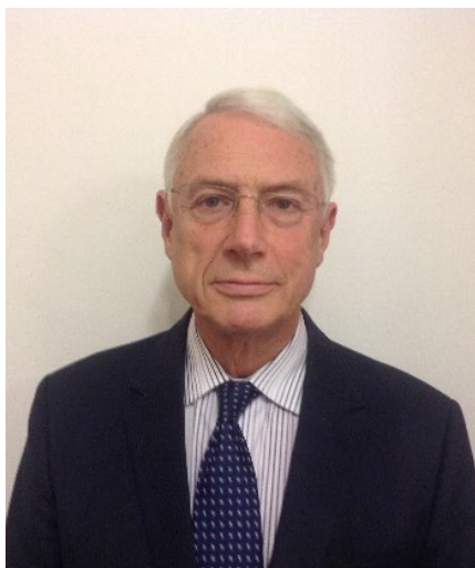
Syr Roderick Evans Comisiynydd Safonau Rhagfyr 2016 – Tachwedd 2019

E-bost: Comisiynydd.Safonau@senedd.cymru