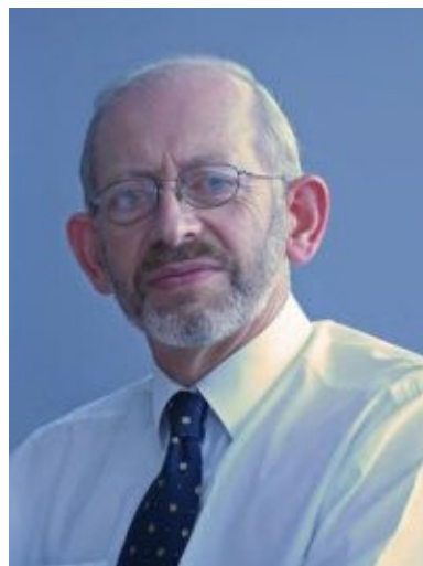
Douglas Bain CBE TD Comisiynydd Safonau Dros Dro y Senedd Tachwedd 2019 - presennol