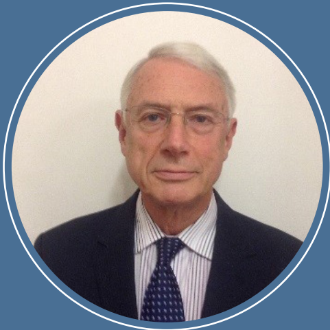
Syr Roderick Evans Comisiynydd Safonau

Prif gyfrifoldebau'r Comisiynydd Safonau yw cael cwynion am ymddygiad Aelodau'r Cynulliad ac ymchwilio iddynt, cyflwyno adroddiadau i'r Cynulliad am ei ymchwiliadau a rhoi cyngor i Aelodau'r Cynulliad a'r cyhoedd am y weithdrefn gwyno.