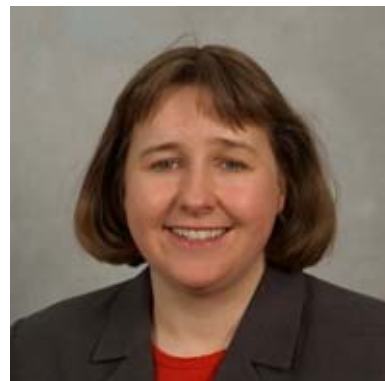
Lynne Neagle Tor-faen Llafur