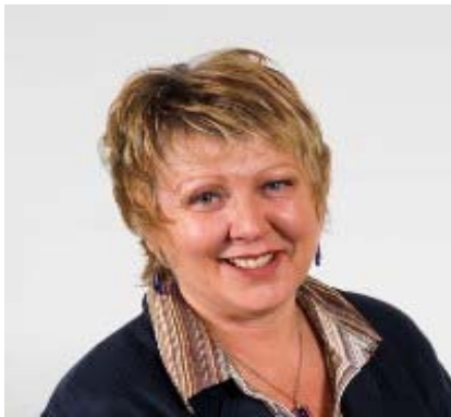
Eleanor Burnham Gogledd Cymru Democratiaid Rhyddfrydol Cymru