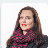
Vikki Howells AS Llafur Cymru

Roedd yr Aelodau a ganlyn hefyd yn aelodau o'r Pwyllgor yn ystod yr ymchwiliad hwn: