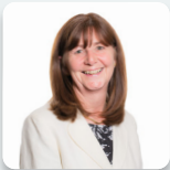
Lesley Griffiths AS Llafur Cymru