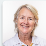
Siân Gwenllian AS Plaid Cymru