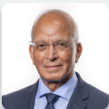
Altaf Hussain AS Ceidwadwyr Cymreig