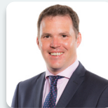
Lee Waters AS * Llafur Cymru

* Esgusododd Lee Waters AS ei hun o'r trafodaethau ar yr adroddiad.