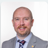
Mabon ap Gwynfor AS Plaid Cymru

Mynychodd yr Aelodau a ganlyn fel dirprwyon yn ystod yr ymchwiliad hwn: